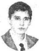
Главный редактор – Красюков Павел Александрович