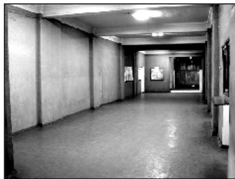
Здесь будет расположено «Место отдыха студентов»

Материалы приносите в профком студентов.