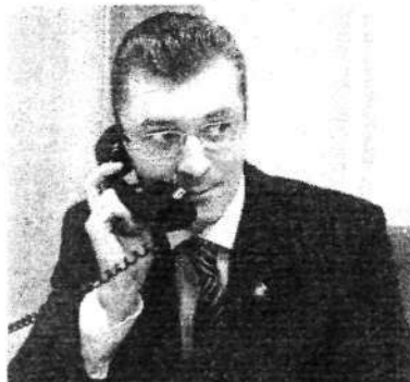
53-04-47 - телефон Профкома студентов